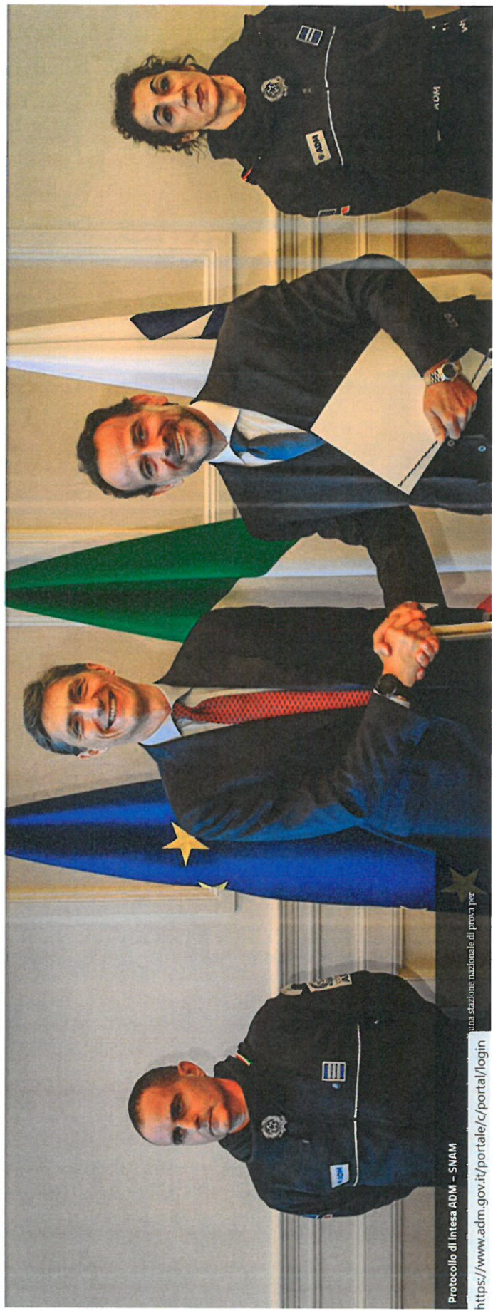
Protocollo di Intesa ADM - SNAM una stazione nazionale di prova per https://www.adm.gov.it/portale/c/portale/login