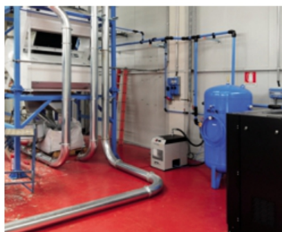
Stazione aria compressa in reparto

quisite, affiancando le industrie con la proposta di nuove tecnologie che applicano questa fonte di energia. La Vincit di oggi è la sintesi di anni di lavoro portati avanti in sinergia con realtà industriali che oggi rappresentano eccellenze mondiali.