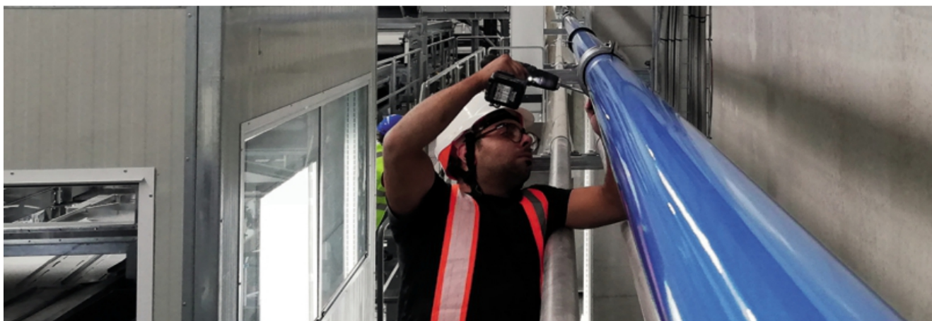
Rete distribuzione aria compressa