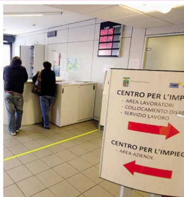
Il centro per l'impiego di Lecco