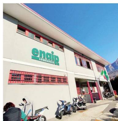
Le sede lechese di Enaip

Il mondo dell'auto cambia non solo dal punto di vista della motorizzazione, ma anche dal punto di vista della sicurezza e della sostenibilità, con un occhio di riguardo al ruolo dell'idrogeno. «Tutti temi fondamentali, per noi di Enaip - spiega il direttore - Un motore