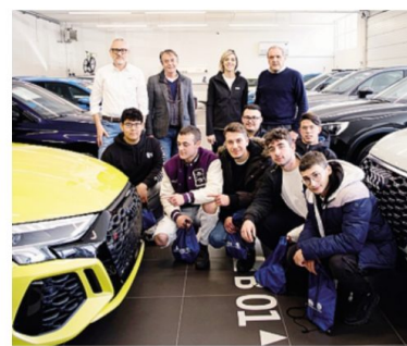
I vertici aziendali e alcuni dei ragazzi del Progetto Academy