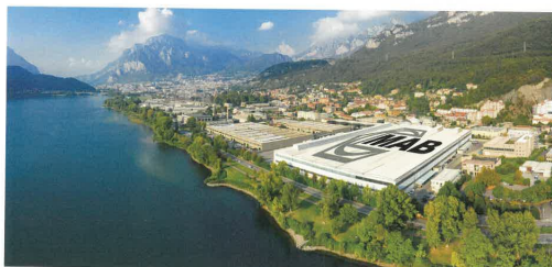
La sede di Legno