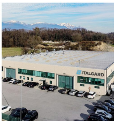
Una veduta dello stabilimento Italgard

fatto che ci ritroviamo in sostanza in competizione con il Sud Italia, che usufruisce di incentivi e possibilità di attingere a contributi a fondo perso: Italgard perde alcune commesse per questa ragione che dà alle imprese beneficiarie margini che noi ci sogniamo». Ciò si aggiunge alla competizione dall'Est Europa in una combinazione «che ci fa perdere ordini. Quando abbiamo partecipato a gare d'appalto relative a produzioni di multinazionali che dalla Cina vogliono tornare a produrre in Italia a vincere sono state aziende del Sud e dell'Est Europa».