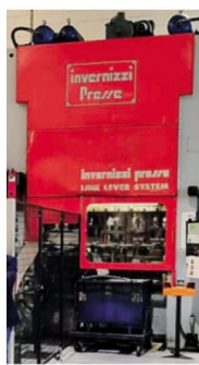
Un impianto della Italgard

di trasformazione della lamiera si è arricchito di un impianto di verniciatura a polvere e a liquido come componente finale - spiega l'azienda - quella che attribuisce il valore aggiunto al prodotto e che permette di completare il ciclo produttivo, mentre i trattamenti di finitura vengono affidati a terzi esterni.