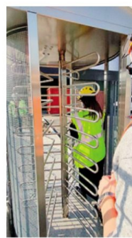
Uno degli ingressi della Ita

giungere centrando diversi obiettivi, a partire dal rispetto delle normative internazionali e nazionali a cui si aggiunge anche il miglioramento nella gestione degli aspetti ambientali e nella prevenzione dell'inquinamento, l'ottimizzazione delle produzioni con una riduzione dei costi, cercando così di «ottenere sia un aumento di soddisfazione dei clienti sia un eventuale aumento di margini operativi. Ci sono inoltre il consolidamento del rapporto con i dipendenti e i collaboratori, basato su responsabilizzazione reciproca, coinvolgimento e su una continua formazione a tutti i livelli». M. Del.