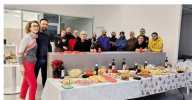
Il team aziendale in un momento di festa

L'azienda è un punto di riferimento per l'impiantistica a livello regionale per i suoi servizi di consulenza, progettazione, installazione, collaudo, manutenzione e assistenza soprattutto in Valtellina, a Lecco, in Brianza e nel Milanese. La sua clientela è costituita da fabbriche, imprese di costruzione e in modo sporadico anche di qualche privato soprattutto per l'installazione di pannelli fotovoltaici e domotica.