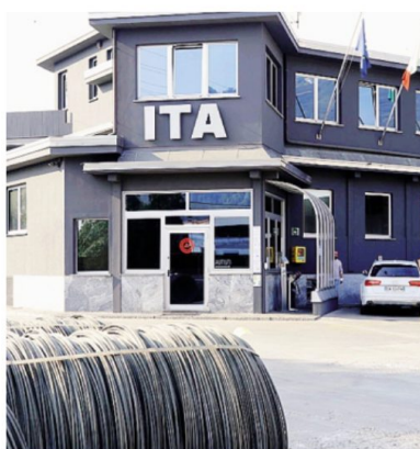
L'unità produttiva della Ita a Calolziocorte