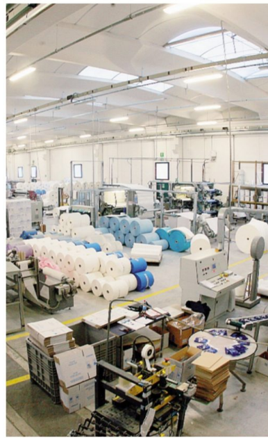
Nell'indice di S&P Global il manifatturiero rimane in contrazione

In 3C Catene sul magazzino si cerca di essere più che forniti: «Mantenere il magazzino costa molto, ma senza magazzino non si vende. I tempi di consegna sono veloci, quindi che ci sia o meno lavoro, il nostro magazzino deve sempre avere determinate soglie garantite dal monitoraggio del nostro sistema gestionale, per evitare di rimanere sguarniti su alcuni articoli o in over stock su altri».