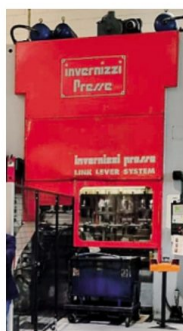
Un impianto della Italgard

di trasformazione della lamiera si è arricchito di un impianto di verniciatura a polvere e a liquido come componente finale - spiega l'azienda - quella che attribuisce il valore aggiunto al prodotto e che permette di completare il ciclo produttivo, mentre i trattamenti di finitura vengono affidati a terzi esterni.