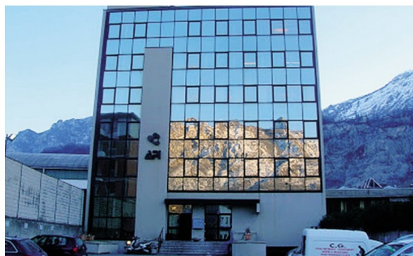
La sede lecchese di Api Lecco Sondrio