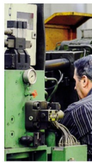
Siderurgia in ripresa

Guardando invece agli aspetti occupazionali, gli addetti - sempre alla fine del primo semestre 2022 - erano oltre 50 mila su un totale di circa 290 mila a livello lariano, con un peso del settore pa-