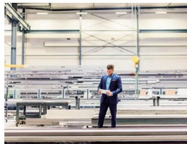
Atie Uno Informatica, a Lecco