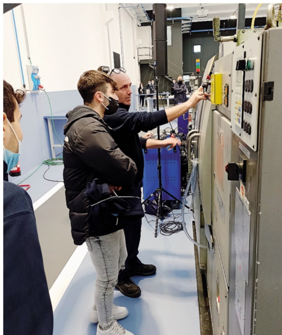
Alcuni impianti a disposizione degli allievi dell'academy della Torneria Colombo