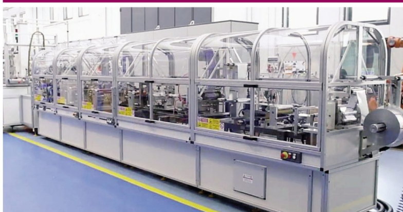
Una linea produttiva della Todema di Cesana Brianza sarà presente all'Expo a Dubai

ECONOMIASONDRIO@LAPROVINCIA.IT Tel. 0342 535511 Fax 0342 535553