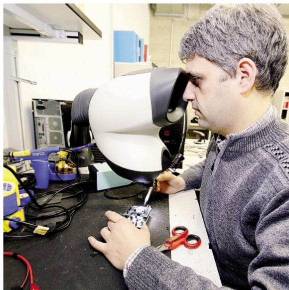
A Lecco al primo febbraio risultavano iscritte 45 startup innovative