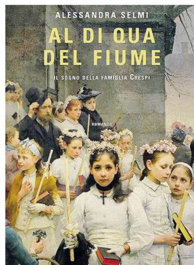
La copertina del libro che verrà presentato oggi all'Api