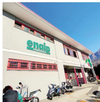
Le sede lechese di Enaip

Il mondo dell'auto cambia non solo dal punto di vista della motorizzazione, ma anche dal punto di vista della sicurezza e della sostenibilità, con un occhio di riguardo al ruolo dell'idrogeno. «Tutti temi fondamentali, per noi di Enaip - spiega il direttore - Un motore