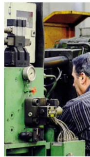
Siderurgia in ripresa

Guardando invece agli aspetti occupazionali, gli addetti - sempre alla fine del primo semestre 2022 - erano oltre 50 mila su un totale di circa 290 mila a livello lariano, con un peso del settore pa-