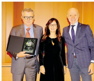
Il premio "Bilancio d'Acciaio" consegnato a Eure Inox

«È il quinto anno - ha ricordato Siderweb - che a Lecco consegniamo questi riconoscimenti (nel 2020 in forma