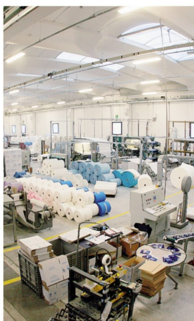
Nell'indice di S&P Global il manifatturiero rimane in contrazione

In 3C Catene sul magazzino si cerca di essere più che forniti: «Mantenere il magazzino costa molto, ma senza magazzino non si vende. I tempi di consegna sono veloci, quindi che ci sia o meno lavoro, il nostro magazzino deve sempre avere determinate soglie garantite dal monitoraggio del nostro sistema gestionale, per evitare di rimanere sguarniti su alcuni articoli o in over stock su altri».