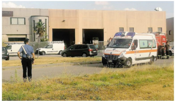
I primi soccorsi alla Frigerio Marmi di Annone: purtroppo saranno inutili. BARTESAGHI