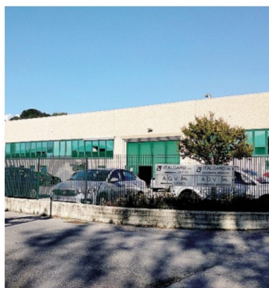
L'azienda ha sede a Sant'Isodoro di Inverigo

«La formazione tecnica - aggiunge - è molto importante sul nostro territorio, ma personalmente ritengo che ciò che oggi manca in modo particolare nella formazione dei giovani sia la base umanistica, incluso l'insegnamento dell'educazione civica, dalla quale parte comunque una forma mentis che porta al rispetto dei luoghi e anche dell'anzianità e dei ruoli, anche a prescindere dalla competenza che si acquisisce. Questo è un valore che poi serve in azienda, visto che si parla tanto di capitale umano e di lasciare le persone libere di esprimersi. Porsi