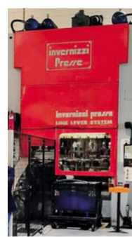
Un impianto della Italgard

di trasformazione della lamiera si è arricchito di un impianto di verniciatura a polvere e a liquido come componente finale - spiega l'azienda - quella che attribuisce il valore aggiunto al prodotto e che permette di completare il ciclo produttivo, mentre i trattamenti di finitura vengono affidati a terzi esterni.