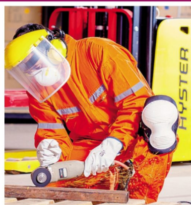
La cautela è il sentimento prevalente tra gli imprenditori