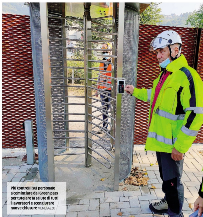
Più controlli sul personale a cominciare dal Green pass per tutelare la salute di tutti i lavoratori e scongiurare nuove chiusure.