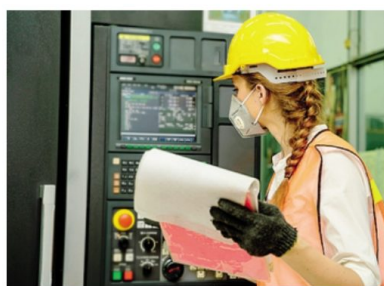
In alcune aziende potrebbero aprire spazi per vaccinare