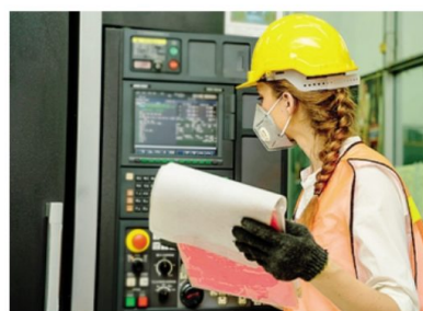
In alcune aziende potrebbero aprire spazi per vaccinare