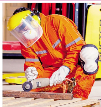
Il costo del lavoro è tra i problemi segnalati da Unionmeccanica