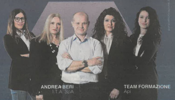
ANDREA BERI I.T.A. SpA