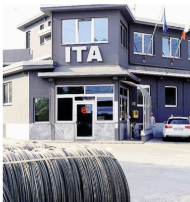
L'unità produttiva della Ita a Calolziocorte