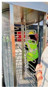
Uno degli ingressi della Ita

giungere centrando diversi obiettivi, a partire dal rispetto delle normative internazionali e nazionali a cui si aggiunge anche il miglioramento nella gestione degli aspetti ambientali e nella prevenzione dell'inquinamento, l'ottimizzazione delle produzioni con una riduzione dei costi, cercando così di «ottenere sia un aumento di soddisfazione dei clienti sia un eventuale aumento di margini operativi. Ci sono inoltre il consolidamento del rapporto con i dipendenti e i collaboratori, basato su responsabilizzazione reciproca, coinvolgimento e su una continua formazione a tutti i livelli». M. Del.