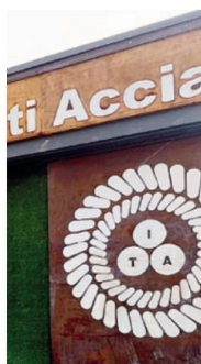
L'insegna della fabbrica

Ad oggi Ita è al 65% di autonomia energetica. Sui investimenti nei plant di produzione,