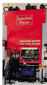
Un impianto della Italgard

di trasformazione della lamiera si è arricchito di un impianto di verniciatura a polvere e a liquido come componente finale - spiega l'azienda - quella che attribuisce il valore aggiunto al prodotto e che permette di completare il ciclo produttivo, mentre i trattamenti di finitura vengono affidati a terzi esterni.