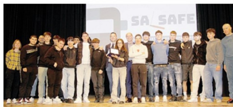
2° premio 3Q Fiochi