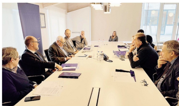
La proposta portata avanti da Confapi Lecco-Sondrio