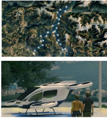
Dall'alto, la cartina del lago con le possibili rotte dei taxi volanti e, nell'altra foto, la simulazione grafica di un mezzo al vertiporto

porti. L'obiettivo è triplice: risolvere problemi di mobilità terrestre dell'area, attrarre capitali e innovazione, cogliere una fetta del mercato globale dei vertiporti, stimato in crescita fino a 10 miliardi di dollari entro il 2032. La presentazione di CE2K ha evidenziato come la conformazione fisica del Lago di Como sia al tempo stesso un'attrazione turistica e un grave ostacolo alla mobilità quotidiana. Insomma i taxi volanti sono un modo intelligente per posizionare la provincia di Lecco come pioniere in Italia per lo sviluppo di un modello di vertiporto replicabile in aree geograficamente complesse come la nostra. «Essere pionieri nello sviluppo di questa infrastruttura sul Lago di Como non è solo dimostrazione di lungimiranza. E' un'opportunità strategica che posiziona il nostro territorio