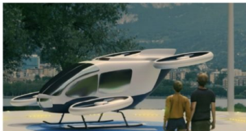
Dall'alto, la cartina del lago con le possibili rotte dei taxi volanti e, nell'altra foto, la simulazione grafica di un mezzo al vertiporto

LECCO (gcf) Arrivano i taxi volanti? Nasce il primo vertiporto sul lago? La mobilità aerea urbana (Uam) non è più fantascienza ma una realtà imminente che bussava alle porte dei nostri territori. Lo si è compreso perfettamente durante lo stimolante incontro «Vertiporti & Innovazione: Lecco si alza in volo» organizzato alla Camera di Commercio di Como-Lecco, sede di Lecco da CE2K, azienda di Valmderera che vanta oltre 35 anni di esperienza nella progettazione e fornitura di apparecchiature elettriche speciali per Ambiente Ex (Atmosfera potenzialmente esplosiva). Una realtà innovativa che da oltre vent'anni, con il marchio Luxolar, ha affiancato alla specializzazione Ex la fornitura di sistemi Segnalazione Ostacoli al Volo, Sistemi Illuminanti per Eliporti e più recentemente per i nascenti verti-