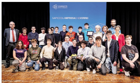
La 3CITL del Badoni, classe vincitrice della prima edizione con il progetto Helmit