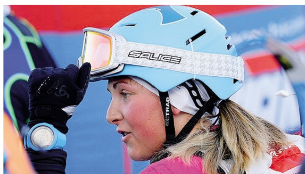
L'azienda si occupa soprattutto di occhiali per il mondo dello sport