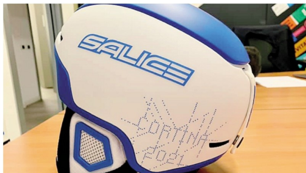
Il casco ufficiale dei Mondiali progettato e realizzato da Salice