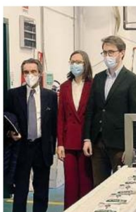
Con i titolari della Dispotech

Ieri, per ribadire i ringraziamenti delle istituzioni e della cittadinanza, il presidente della Regione Attilio Fontana ha visitato lo stabilimento dell'area industriale insie-