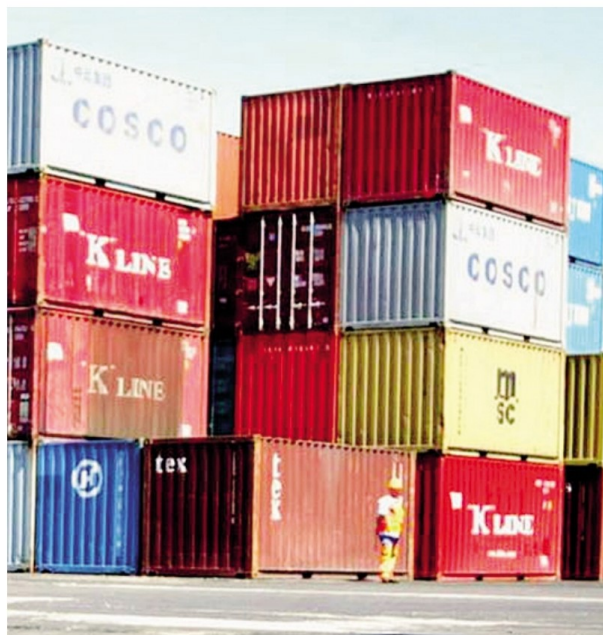
Il nuovo bando Simest (Gruppo Cdp) è a sostegno dell'internazionalizzazione