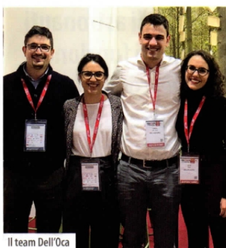
Il team Dell'Oca

La famiglia Dell'Oca vanta tre generazioni attive nella lavorazione del legno per un totale di 85 anni di attività familiare: si va dalla falegnameria dedicata all'arredo passando per imballi di prodotti caseari e fino al packaging di confezionamento per alimenti, core business di Dell'Oca Srl. L'ingresso della terza generazione, nel 2015, ha conferito all'azienda di Delebio (in provincia di Sondrio) un'ulteriore spinta verso un presente che, a un'attività di produzione e distribuzione ramificata nel Nord Italia, accosti anche una precisa attenzione verso la salvaguardia ambientale.