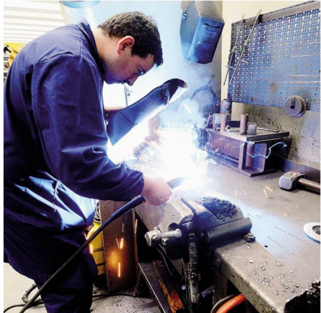
Il blocco dei licenziamenti non verrà prorogato