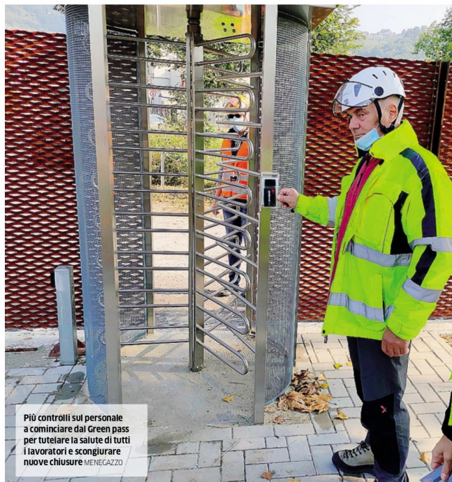
Più controlli sul personale a cominciare dal Green pass per tutelare la salute di tutti i lavoratori e scongiurare nuove chiusure. MENEGAZZO

■ «Il tampone non sia pagato dall'azienda. Non è giusto per i vaccinati»