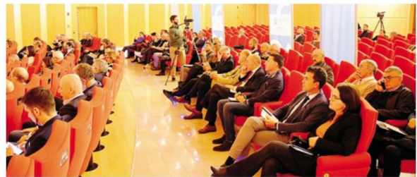
L'evento "Bilanci d'Acciaio" è stato ospitato dalla Camera di Commercio MENECAZZO