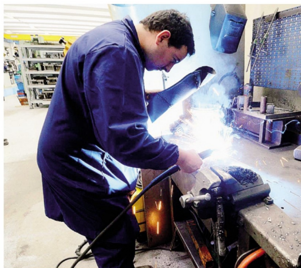
L'aumento dei tassi rende più complicate le decisioni di investimento