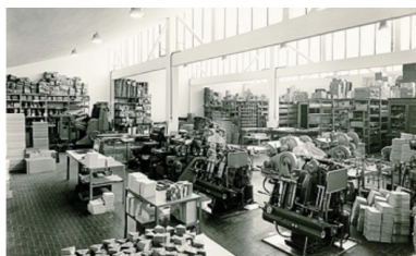
Una foto storica: l'azienda nel 1963