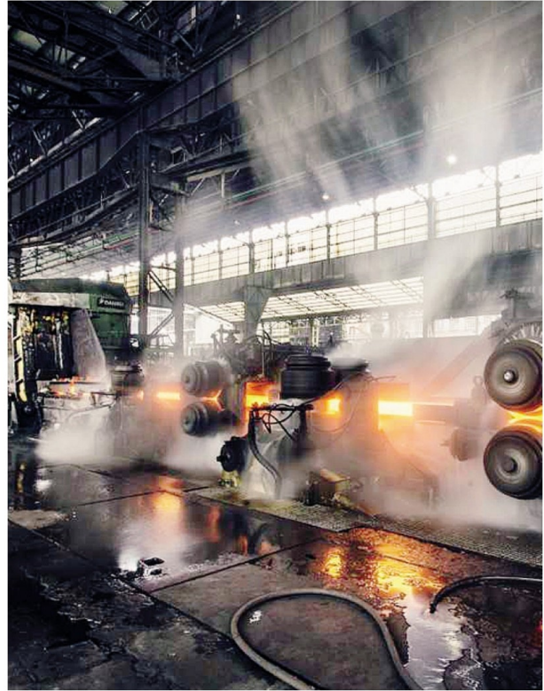
La componente di costo dell'energia per alcuni settori è molto pesante