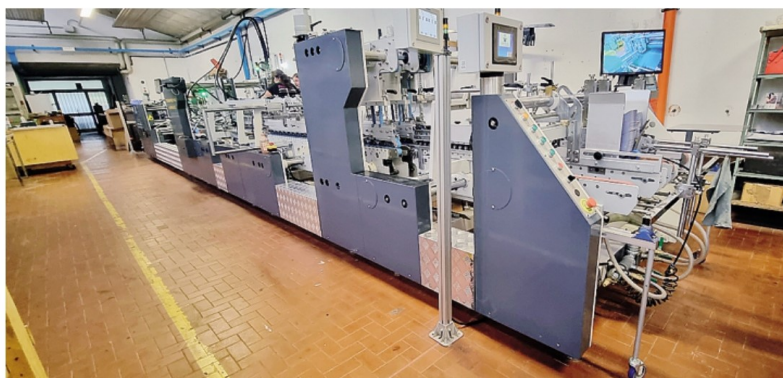
La nuova macchina "piega incolla", uno degli investimenti più recenti dell'Arte grafica Valsecchi