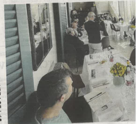
L'evento è stato organizzato dal nostro gruppo editoriale Netweek nell'ambito del ciclo di incontri degli Amici del Giornale di Merate per parlare di lavoro, formazione, ricerca, impresa