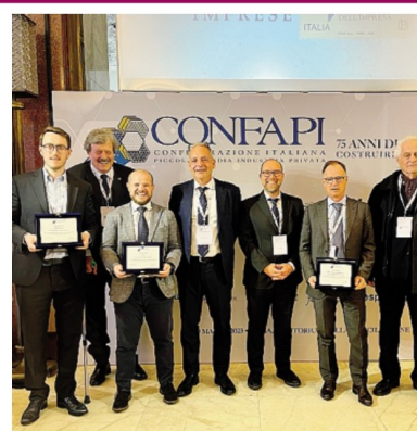
La nutrita delegazione lecchese che ha raggiunto l'Auditorium della Conciliazione di Roma per i festeggiamenti in casa Api