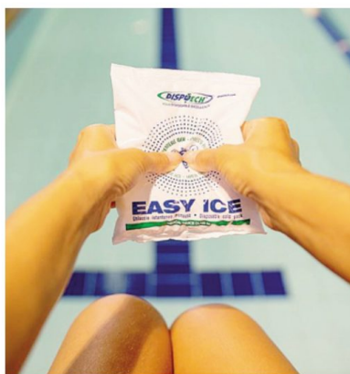
«Easy ice», il ghiaccio istantaneo monouso della Dispotech