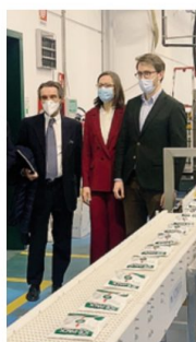
La visita del presidente lombardo Attilio Fontana (a sinistra)

«Il nostro cavallo di battaglia - si legge in una nota aziendale - è l'essere distinti come fornitori di prodotti medicali monouso altamente igienici, fabbricati con materiali di alta qualità, facili da smaltire, personalizzabili con il proprio logo e nel packaging. Per Dispotech personalizzare un prodotto non significa