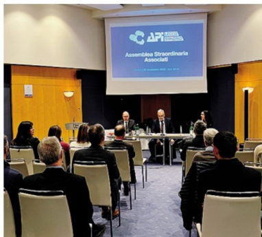
L'assemblea straordinaria di Confapi Lecco Sondrio

A dover essere migliorati sono i "beni comuni", ovvero gli indicatori che misurano gli impatti ambientali, poi "dono, gratuità e meritorietà" cioè gli indicatori che mi-