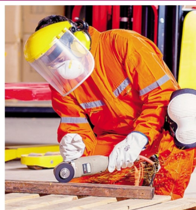
Gli imprenditori lecchesi avvertono il calo della domanda