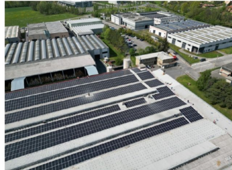
A sinistra l'interno e l'esterno, attraverso una veduta aerea sull'impianto fotovoltaico, del capannone in via Repubblica ad Annone di Brianza