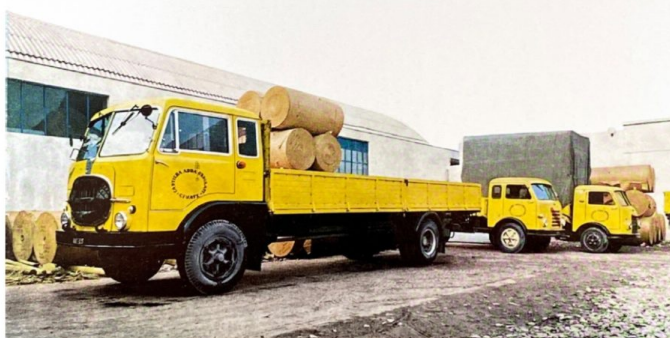
A sinistra i camion che venivano utilizzati per il trasporto delle bobine dalla cartiera di Civate. Sopra le medesime bobine e il primo ondulatore installato

macchina ormai storica verrà sostituita con un'innovativa fustellatrice piana - ha spiegato il fondatore che oggi è affiancato alla guida dell'azienda da figli e nipoti - Un investimento importante, ma fondamentale per affacciarsi a un nuovo mercato, quello di vassoi e contenitori per i supermercati».