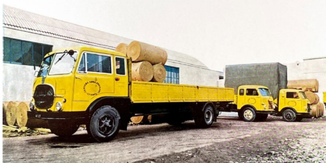
A sinistra i camion che venivano utilizzati per il trasporto delle bobine dalla cartiera di Civate. Sopra le medesime bobine e il primo ondulatore installato

macchina ormai storica verrà sostituita con un'innovativa fustellatrice piana - ha spiegato il fondatore che oggi è affiancato alla guida dell'azienda da figli e nipoti - Un investimento importante, ma fondamentale per affacciarsi a un nuovo mercato, quello di vassoi e contenitori per i supermercati».