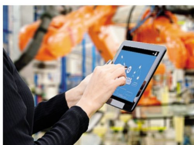
Le paure sulla sicurezza riguardano la criminalità digitale

Dalle imprese intervistate, spiega l'indagine, «emergono tuttavia diffuse certezze: la tecnologia non potrà mai sostituire l'intuito e le capacità dell'uomo nel progresso scientifico, ma ne sarebbe supporto valido ad esempio per la sperimentazione scientifica. Ne è convinta più della metà delle imprese, ma un ulteriore 31% si dichiara forte-