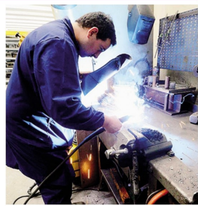
Molte piccole imprese sono in difficoltà per il rialzo dei tassi