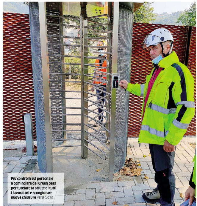
Più controlli sul personale a cominciare dal Green pass per tutelare la salute di tutti i lavoratori e scongiurare nuove chiusure.