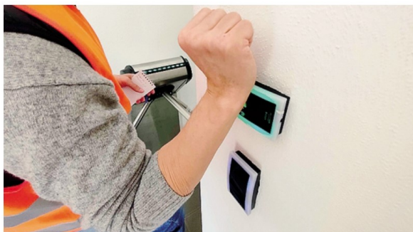
I rilevatori automatici di temperatura che consentono (o impediscono) l'accesso agli spogliatoi. MENEGAZZO